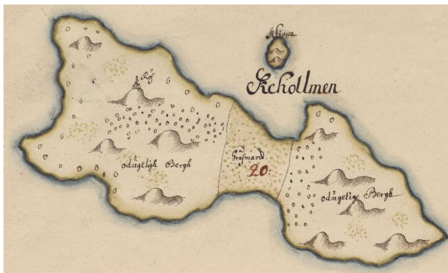
Det monumentala gravröset på Kehollmen är närmast återgivet som ett sjömärke av Söderling. Gräsmarken på ön kunde föda 12 får över sommaren.