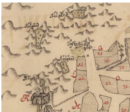
Kålgårdarna till Dugatorp i Gällinge socken låg inklämda mellan bergsknallarna norr om hustomten.