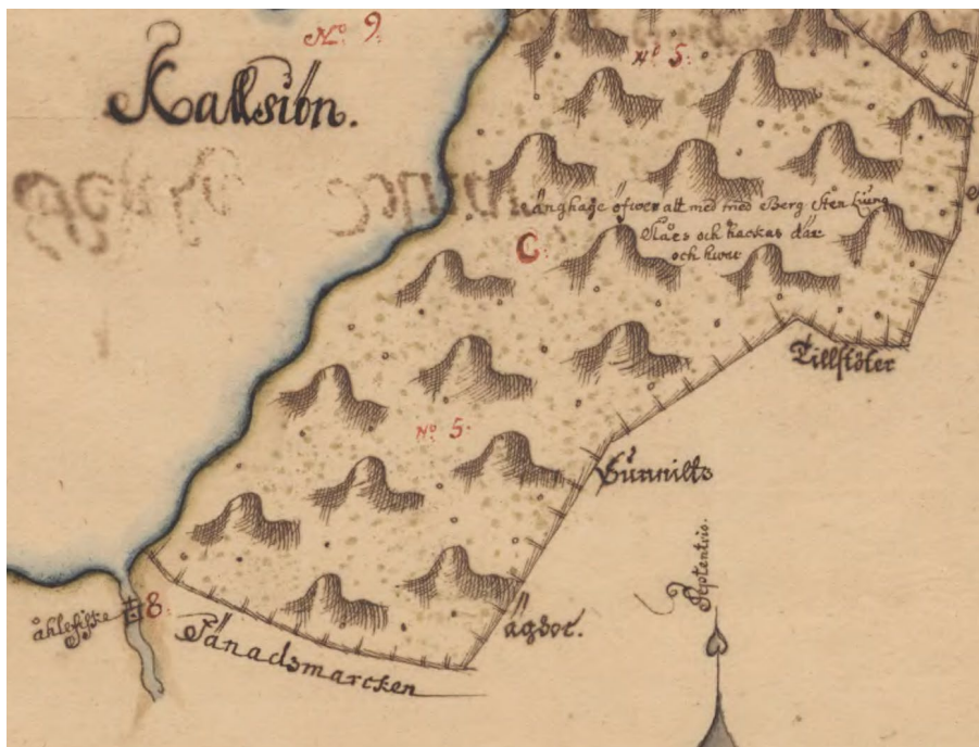
Nummer 8 är ållhuset som knappt gav några ålar. I Kalsjön förekom nätfiske på våren och mete under sommaren.