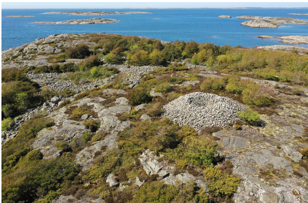
Kebolmen utanför Särö är idag ett naturreservat. Det stora gravröset var förmodligen ursprungligen en revirmarkering för bronsålderns fiskare och säljägare.