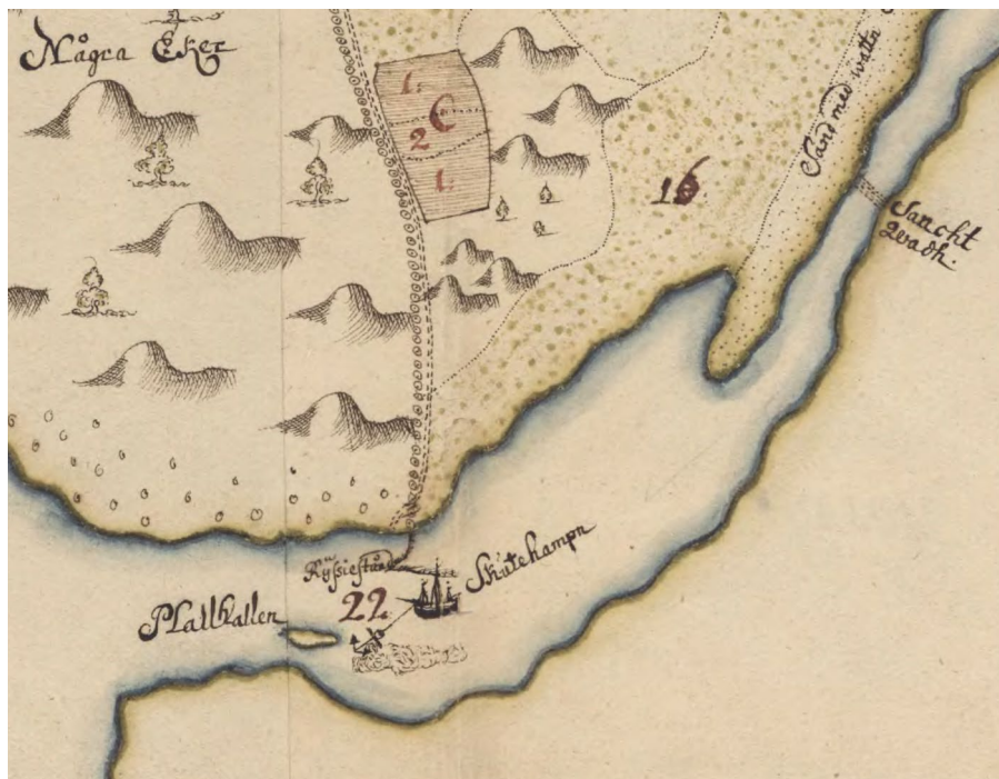
I sundet mellan Särö och fastlandet låg skutehamnen och där fanns två fasta ryssjor. Lite längre in i den grunda delen ligger vadstället.