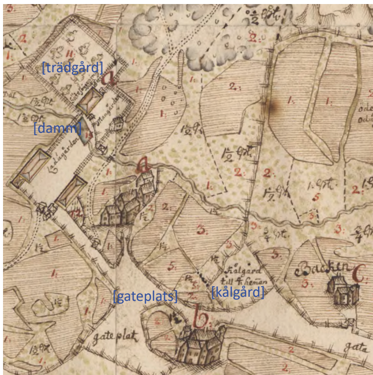
Ättarps mangård (a) ligger mellan en ruddamn och en fruktträdgård. Från ladugården leder en fågata till utmarken i öster. Hussamlingarna b och c tillhör underliggande gårdar.

heltäckande men innehåller ett tvärsnitt av bebyggelser från Breareds och Enslövs socknar i söder till Lindome och Släps socknar i norr. Nedan ska säteriet Ättarp och några tematiska företeelser presenteras för att ge en bild av det halländska landskapet och villkoren för dess bondebefolkning vid 1600-talets slut.