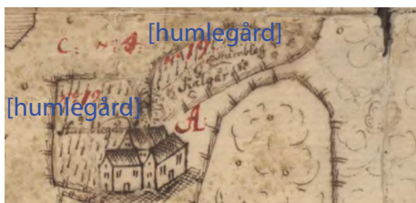
Sandsered i Drängsreds socken hade två inbägnade humlegårdar på 500 stänger (19). Söderling markerar detta med ett antal humlestövar.