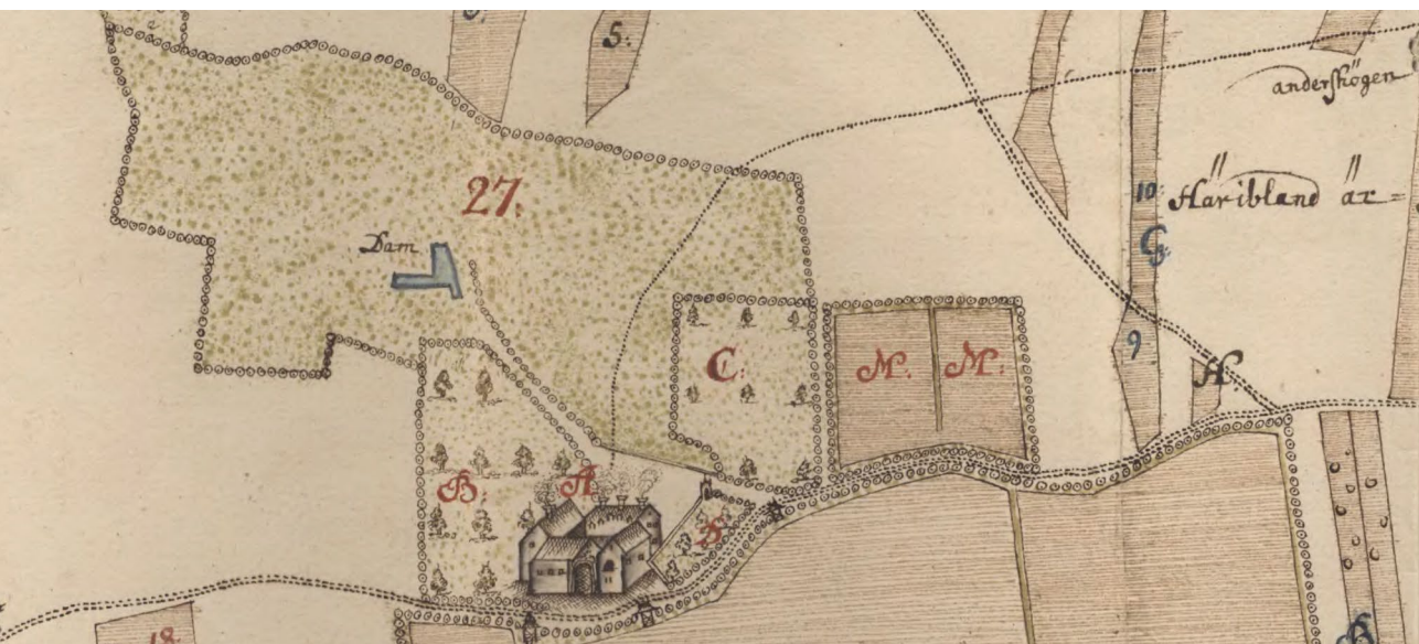
Landskapet runt Vallda säteri präglades av raka geometriska former både för fält och för trädgårdar. Den mesta åkermarken var utbruten ur tegskiftet med Vallda by och bildade ett större gårde söder om gården.