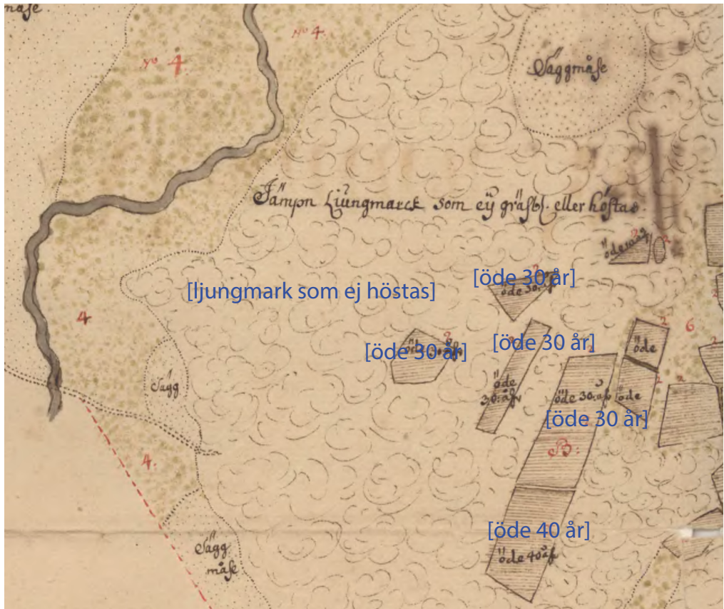
Ödeåkrarna i Övre Stixered låg omgivna av en slät ljungmark som varken hade inslag av gräs eller slogs.

Hanhals socken hade legat öde i nio år då det togs upp igen av en bonde mot tre års frihet och nerskrivning av skatten (M2:60). En tidig ödegård finns på kartan över Kärret i Ölmevalla socken. Söderling har en lång utredning om att det före mannaminne skulle ha funnits en gård på Kärrets nuvarande ägor och att det möjligen hade bott en smed på den. Han placerar tomten på betesmarken och konstaterar att dess ränta ingår i Kärrets avgifter. Troligen är det fråga om en medeltida ödegård (M2:45).