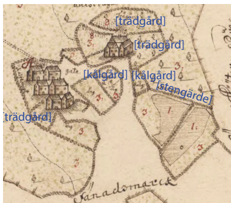
Backhults hustomter i Morups socken, omgivna av tre trädgårdar, två kålgårdar och några ängshagar, alla ingärdade med stenvmurar.